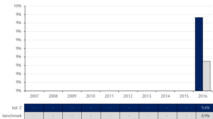
Roczne stopy zwrotu PKO Papierów Dłużnych USD