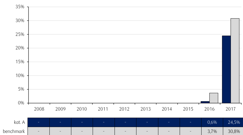
Roczne stopy zwrotu PKO Akcji Rynku Azji i Pacyfiku