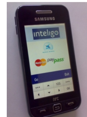
Karta płatnicza PayPass na karcie SIM